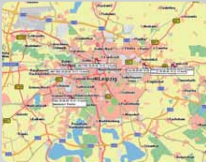
Fahrzeug-Lokalisierung in Echtzeit

Gefahrene Strecken lassen sich jederzeit recherchieren – natürlich stets mit aktuellem Kartenmaterial.